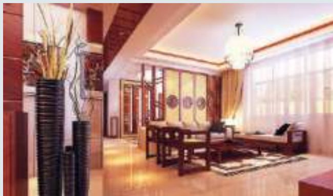
横梁压顶通常是房屋中最常见的风水禁忌，受房屋横梁压顶的影响，一方面会影响财运，另一方面也会对人的健康产生不可避免的影响。

1) 此煞专门针对孕妇和胎儿的健康，若家宅要进行动土大装修，或是要粉刷油漆，最好事先安排孕妇到娘家暂住，待完工后再接回家即可。