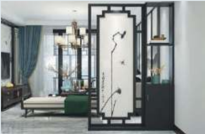
屏风具有阻挡的作用，例如挡风、挡视线，乃至挡灾挡煞气。