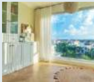
加装“遮光窗帘”有效阻挡住刺眼的光线，化解屋外光线太过强烈形成的“光煞”。

风水讲究藏风聚气，聚气凝神，然而光辐射形成的强烈气场会破坏生气的凝聚，同时光波磁场和人体正常磁场的频率差别太大，容易破坏人体正常磁场，进而扰乱人体正常的生理时钟，长期下来会造成人精神紧张、心绪烦躁、情绪低落、身体乏力等神经衰弱的症状，进而影响到日常工作和生活，严重的话甚至还会引发血光之灾，因此千万不能等闲视之！