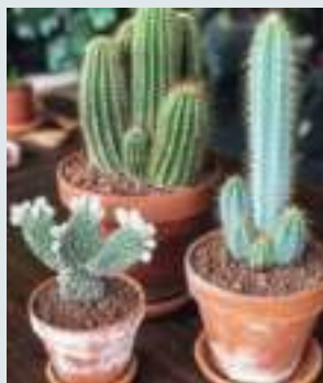
带刺的植物会产生尖角冲煞气，不适宜放置在家中，会对家庭运有一定影响。

很多人都喜欢在家中养几盆植物，不仅净化空气，还可以带来美感。不过，不是所有植物都对有益，从风水角度来看，种对植物可以化解煞气，升旺财运；相反，种错植物不仅无法招财化煞，还会引来疾病，所以植物风水是双面刃，必须拿捏得当方能发挥效应。